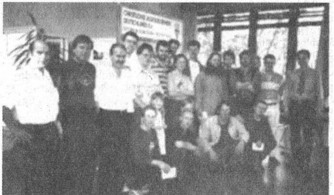
Die Gewinner der Grand,Prix-Wertung beim Finale in Vaihingen/enz