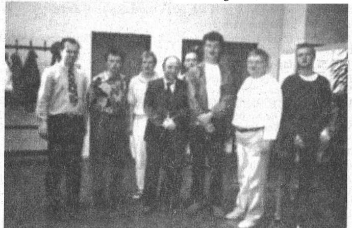
Die Geldpreis-Sieger beim Kaltenstein-Open 1997